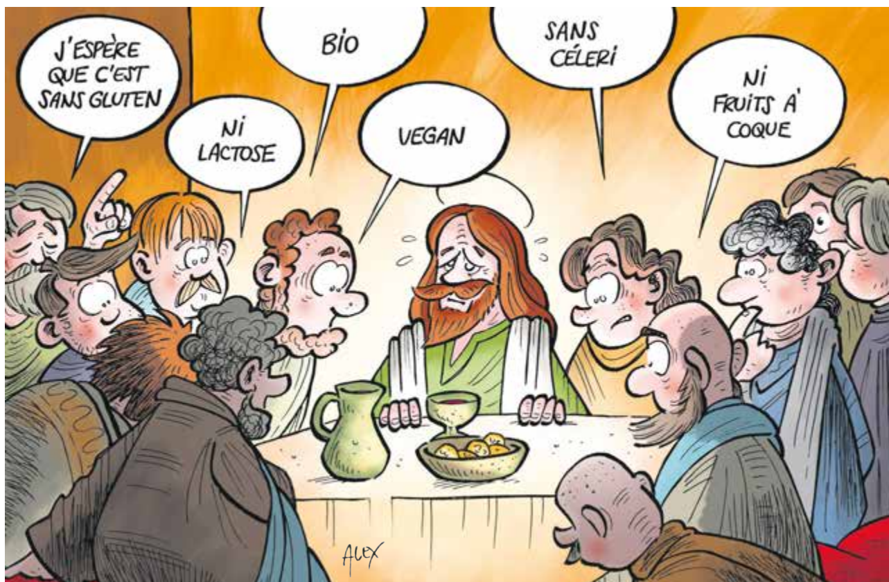
Soirée discussion-débat autour du thème de la Cène

Titre intentionnellement provocateur pour parler d'un sacrement du christianisme. Titre provocateur pour inviter à s'extraitre des pesanteurs de la tradition chrétienne. Mais pour s'extraitre, il faut connaître et comprendre pourquoi, un jour, des hommes surtout, car les femmes n'avaient pas voix