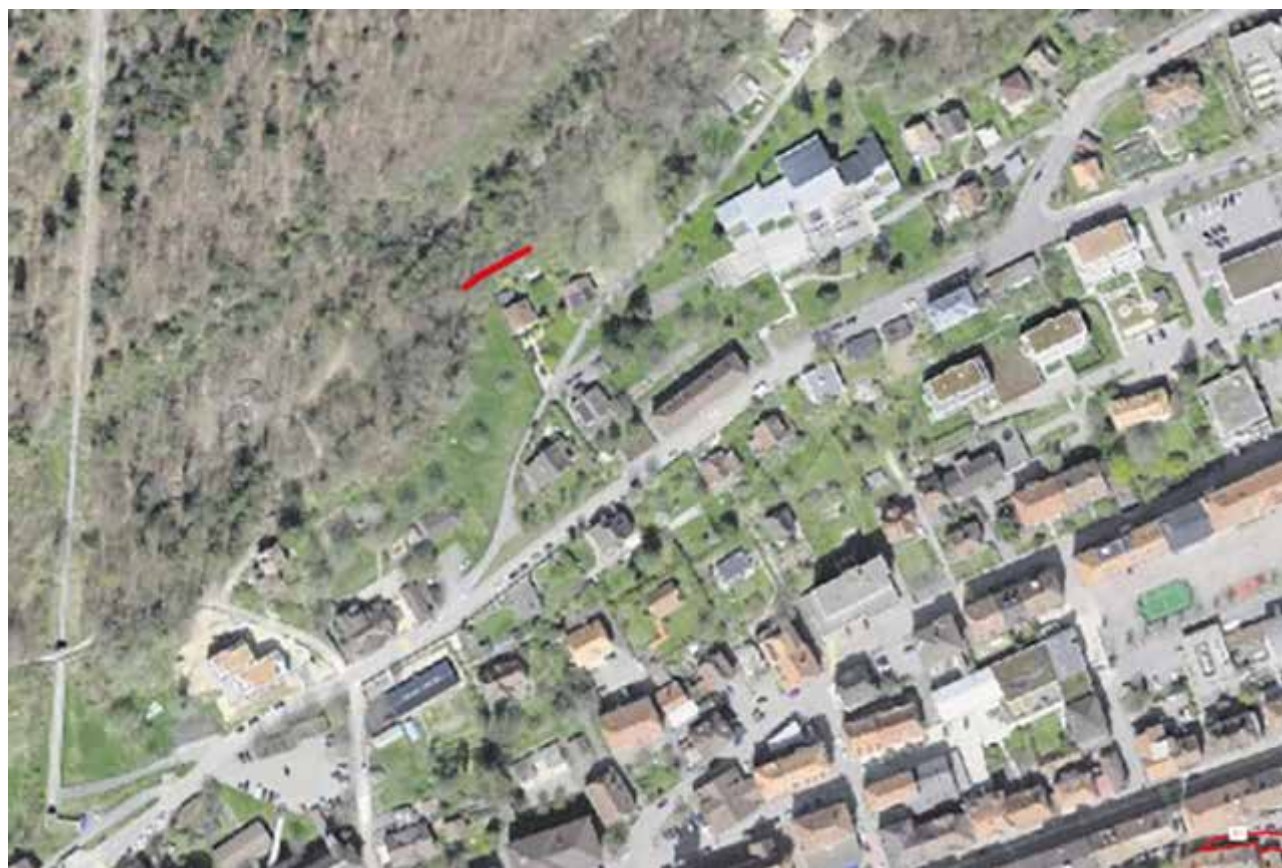
En rouge, emplacement des filets de protection

Les travaux dans les deux autres secteurs au bénéfice actuellement d'un