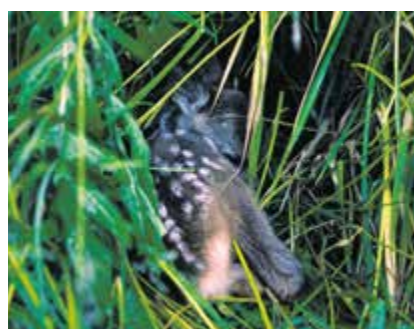
Grâce à l'action des bénévoles de l'association régionale, il est aisé de sauver les faons, bien cachés dans l'herbe haute, d'une mort atroce, photo: sauvetage faons Jura bernois, Scott Vuilleumier

Dans ce courrier, les élus ont pu vérifier une fois encore que cette action est très efficace: grâce à leurs drones et à leurs interventions très tôt le matin, les engagés de cette association réussissent en effet à sauver à peu près 100 % des faons tapis dans les hautes herbes! L'utilisation des engins techniques est en effet très précieuse et double les chances de réussite, par rapport à la recherche humaine. Les drones détectent les animaux grâce à la chaleur émise par leurs corps, les bénévoles les mettent ensuite en sécurité pendant la fauche, puis les