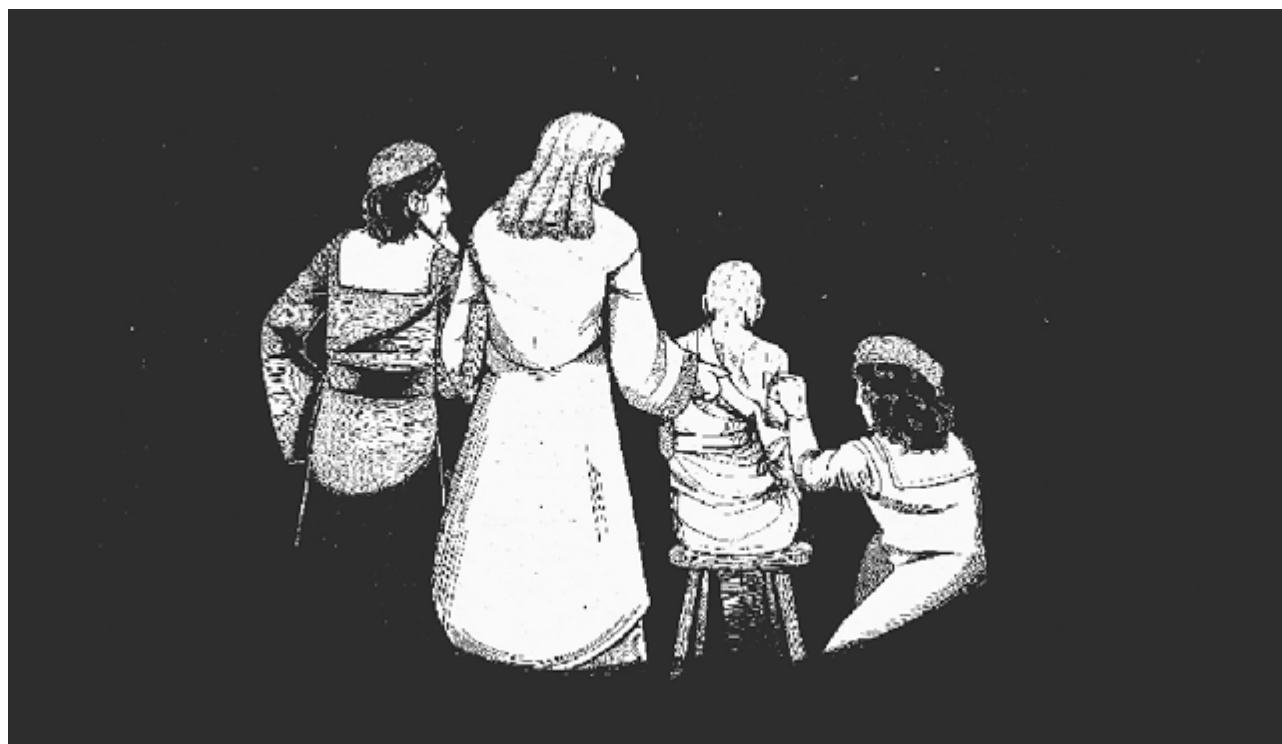
Afin de trouver un indice physique, le corps de la prétendue sorcière est rasé et une recherche de marque diabolique est effectuée à l'aide d'aiguilles plantées dans la peau. Cette étape s'ensuit de la torture pour obtenir des aveux. Illustration: Adryan Zeroual.

À partir du 16 e siècle, le corps humain et ses mystères suscitent une curiosité croissante, favorisant des avancées majeures en anatomie. Parallèlement, dans le contexte des procès de sorcellerie, le corps prend une signification particulière. D'après les croyances, une