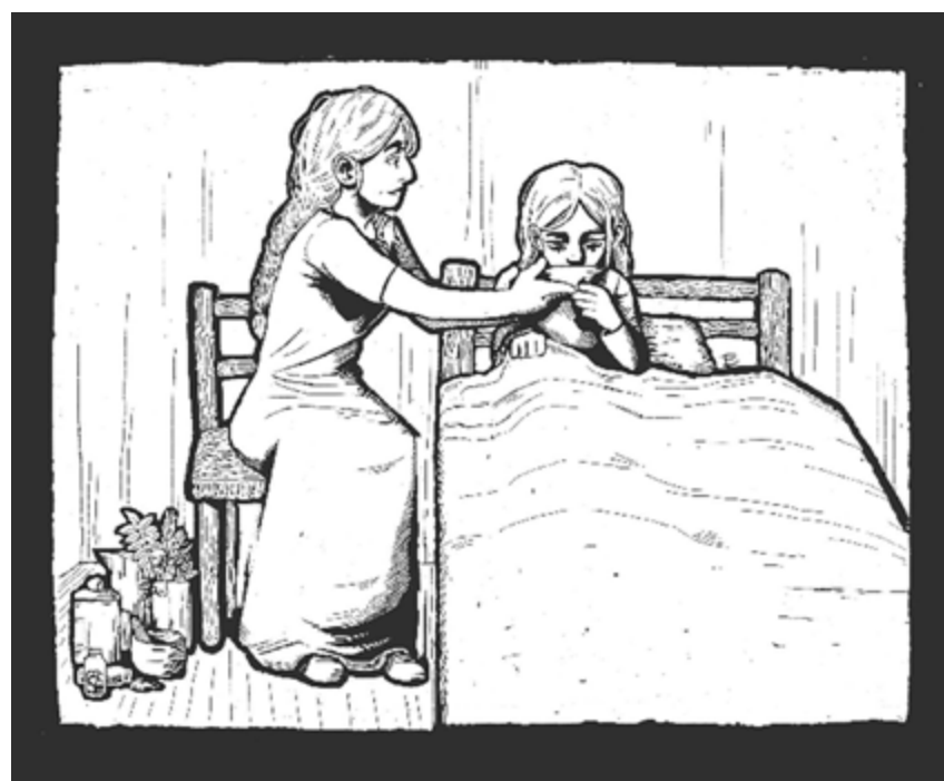
Illustration: Adryan Zeroual

Musée de Saint-Imier Rue Saint-Martin 8, 2610 Saint-Imier Du 27 février au 26 octobre Mardi à dimanche de 14 h à 17 h