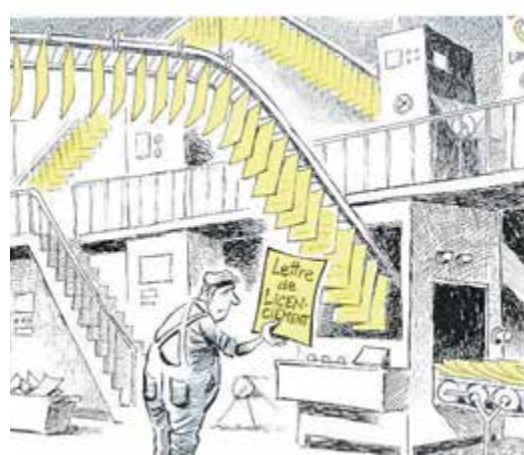
Chappatte, 28 août. Le 27 août, l'éditeur Tamedia annonce la fermeture de ses centres d'impression de Zürich et Bussigny, de même que des suppressions de postes massives dans ses rédactions. Le Temps

Rétro 24 du dessin de presse suisse (extraits) Salle de spectacles de Saint-Imier À découvrir lors des spectacles proposés (réservé aux spectateurs) Ouvert à toutes et tous le samedi 15 mars de 14 h à 17 h (entrée libre)