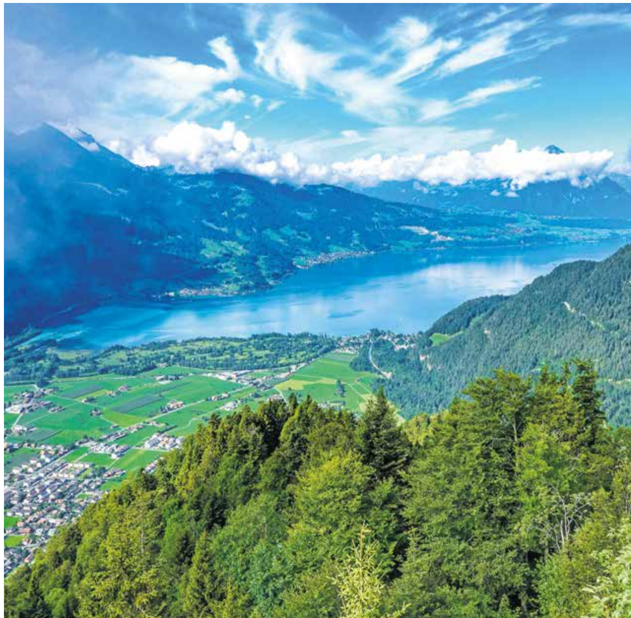
La destination d'Interlaken s'est imposée comme un choix unanime

À ce jour, 96% des 2000 francs nécessaires ont déjà été collectés grâce à la générosité de 59 contributeurs.